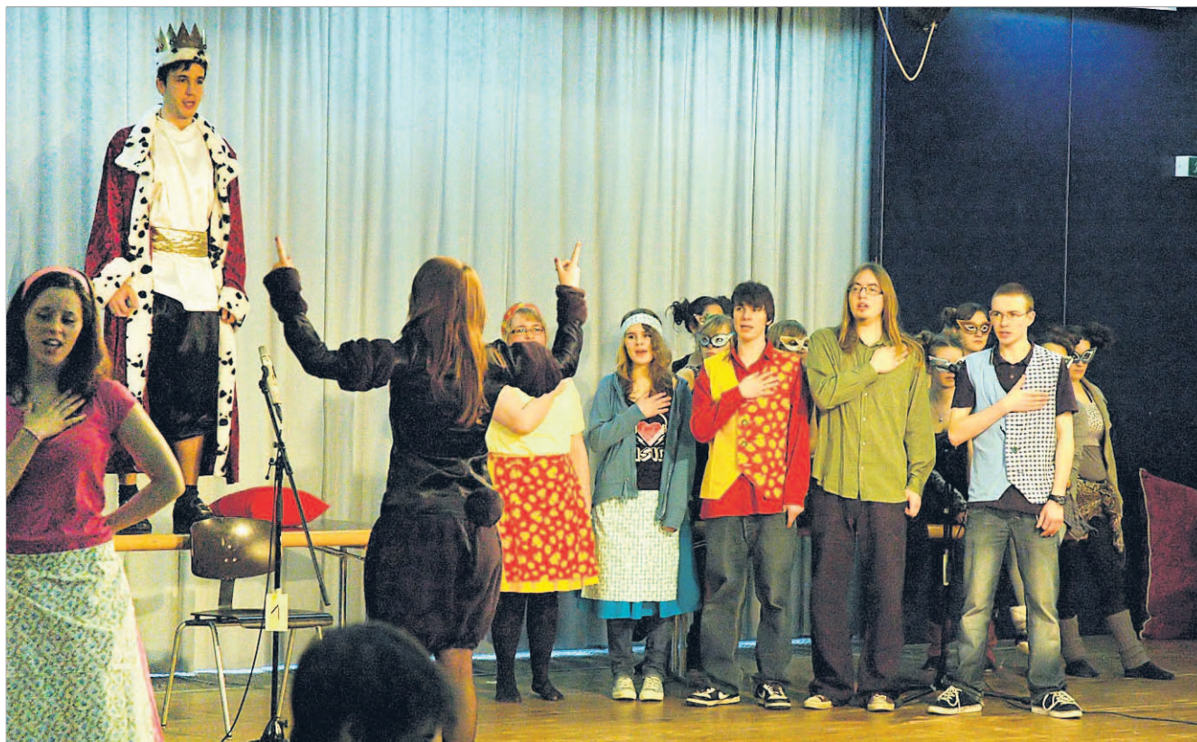
GEHORSAM Die Kantonsschüler spielen das Volk, welches immer dasselbe Lied für seinen König singen muss. CORINNE WIESMANN

Trotz kleiner Unsicherheiten und Wackler in den Darbietungen, unter den jungen Darstellern gibt es echte Talente. «Wir haben unser Musical nach dem Können unserer Darsteller produziert. Und nicht, wie bei anderen Musicals, die Darsteller gesucht, nachdem wir uns für ein