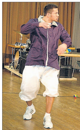
JEDER EIN STAR Das Musical ist auf die individuellen Talente der Jugendlichen zugeschnitten.

Nicht nur die Darsteller taten in den letzten Wochen viel für die Aufführung. Auch hinter den Kulissen wurde hart gearbeitet. Die Schüler haben alle Kostü-